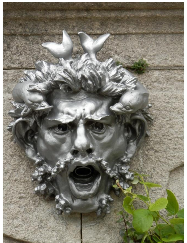
Mascaron attribué à l'atelier d'Auguste Rodin