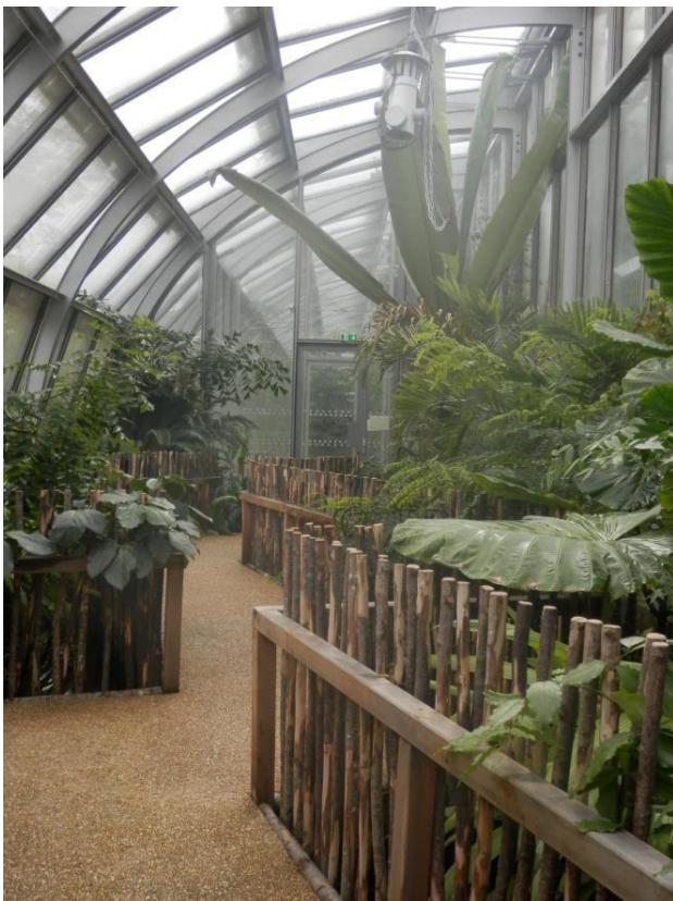
Serre contemporaine Asie