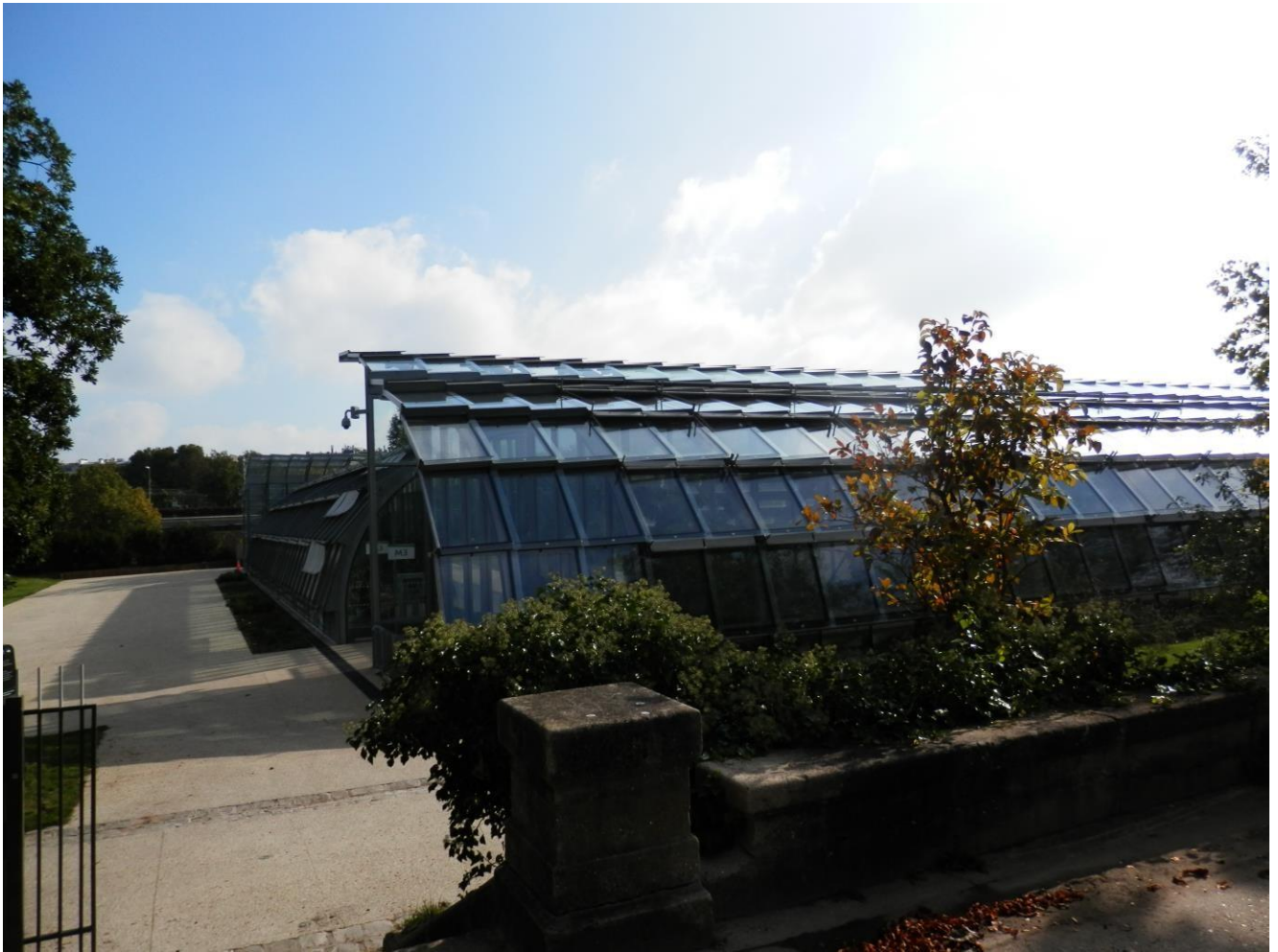
Les serres contemporaines construites par Marc Mimram,