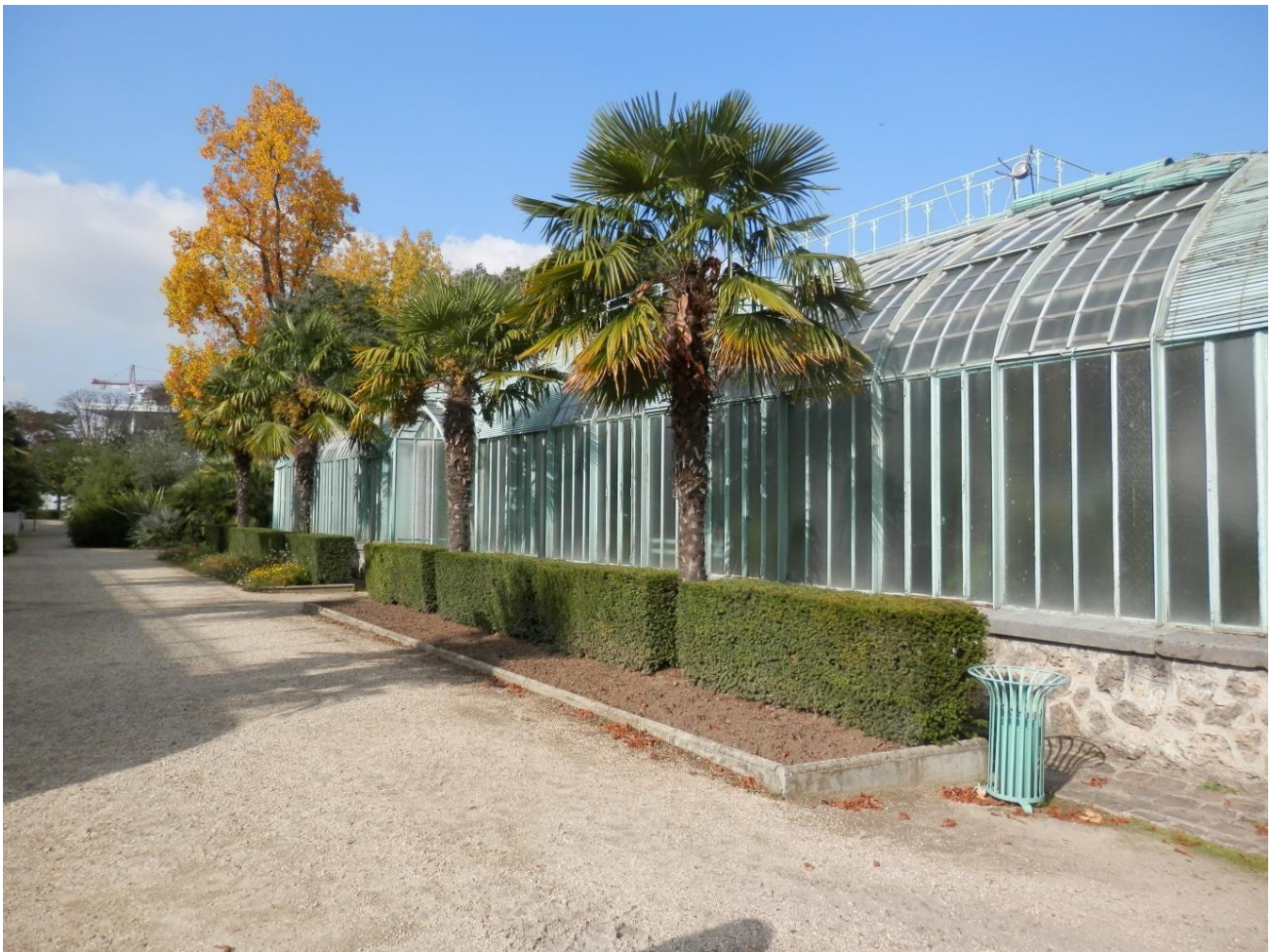
Les serres historiques construites par Camille Formigé